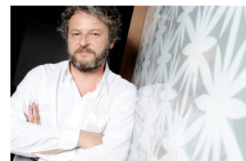
Portrait Tobias Rehberger

Die Fragestellungen von Tobias Rehberger gruppieren sich alle um das Kunstwerk: Was ist ein Werk? Woher kommt es und wohin entwickelt es sich? Was kann es sein, und als was und durch was wird es definiert? Was differenziert es zu etwas Anderem?