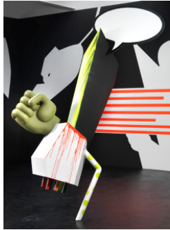
7 Jahre Skulptur und Neid, Tobias Rehberger © Tobias Rehberger, 2008 courtesy neugerriemschneider, Berlin

Von der Skulpturenserie „Mütter“ entstehen für das Essl Museum fünf neue Werke. Zu diesen Arbeiten, die als Modelle für ein Wabenregal, eine Hundehütte oder als Wendeltreppe dienen, sind im Museumsshop Zertifikate erhältlich, die den Käufer zum freien Nachbau bzw. zur Erstellung eines entsprechenden Objektes berechtigen. Vom Künstler gibt es keine spezifischen Angaben zur materiellen Ausführung oder Baupläne der Skulptur.