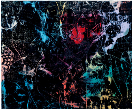
Hubert Scheibl: O.T., 2008 photo: Franz Schachinger, © Hubert Scheibl