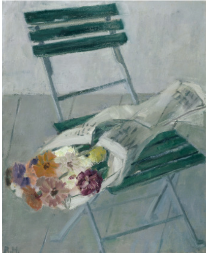
Kurt Moldovan: Blatt aus der Mappe: Alice im Wunderland, 1973

Zeit- und medienübergreifenden Verwandtschaften aufgezeigt, denen ein gemeinsames kosmologisches Weltverständnis zu Grunde liegt.