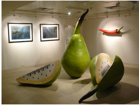
Michael Kristine - MIGRATING IDENTITIES: Hybrid Family and This Chilly Is Not Indian, 2009, © Sammlung Essl Privatstiftung, 2009